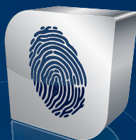
Zutrittskontrolle & Zeiterfassung