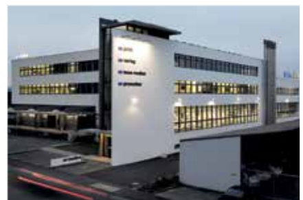
UD Print Luzern